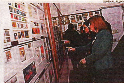
LA MUESTRA FUE INAUGURADA AYER CON PRESENCIA DE AUTORIDADES.