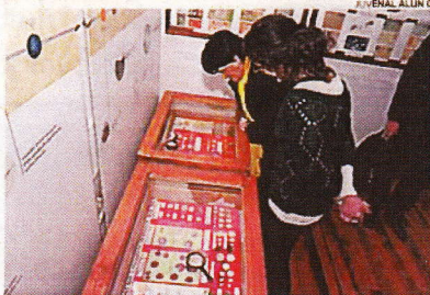
MONEDAS Y BILLETES SON ALGUNOS DE LOS ATRACTIVOS.