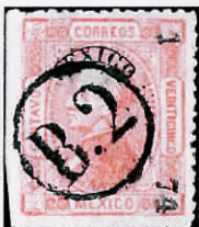
Mailbox B(uzon) 2 Mexico

Nun zur 25 C. der Ausgabe von 1872, welche mit gut 2 Mio. verkauften Marken die häufigste dieser Ausgabe ist. Im internationalen Vergleich sind das bescheidene Zahlen, doch wegen der schon erwähnten geringen Zahl an ernsthaften Sammlern dieser Ausgabe ist immer noch ansehnliches Material auf dem Markt. Nachfolgend einige Stücke von gewöhnlichen Distrikten.