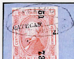
Rio Grande Zacatecas