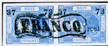
"Franco" Matehuala San Luis Potosi