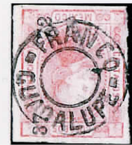
Guadalupe San Luis Potosi

Ein paar weitere Stücke, die von ziemlich gewöhnlichen Distrikten stammen und sich dennoch in jeder Sammlung recht gut machen.