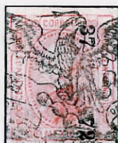
Cerritos San Luis Potosi