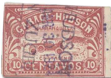
Marke mit Stempel GARAGE HUDSON/SALOMON ZUGBI sowie Datumsstempel „30. April 1924 (Format ABR 30 1924)

Eine detaillierte graphische Untersuchung der Marken hat ergeben, dass zum Druck der Marken nur ein Klischee benutzt wurde.