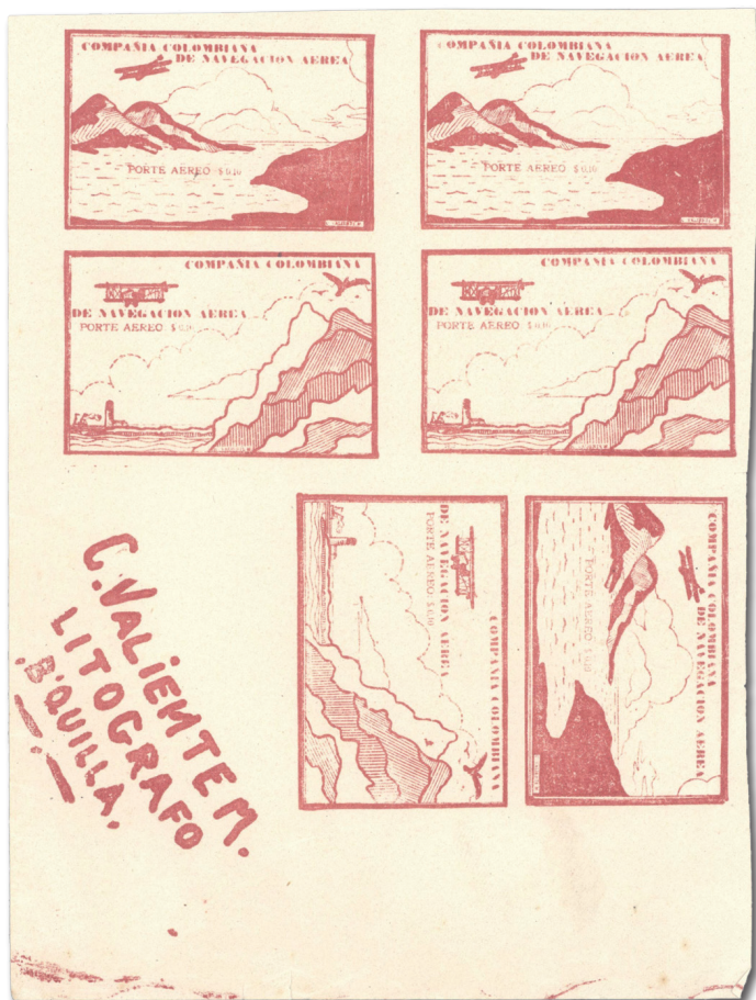
Eckrandsechserblock mit zwei Marken in Yuxta Position der CCNA MiNr. 13–14 mit dem Druckereinamen im Bogenrand

Eine der Eigenheiten dieser Druckerei waren Bogen in oftmals seltsamen Größen und Markenordnungen bis hin zu, wie im gezeigten Eckrandsechserblock, Marken in Yuxta Position. Die rote Farbe der CCNA, MiNr. 13–14 / 15–16 entspricht dabei der Farbe der roten Marke der „Garage Hudson“.