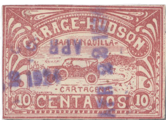
Marke mit Datumsstempel vom 22. April 1924 (Format APR 22 1924)

Die ausgegebenen Briefmarken zeigen im Motiv ein Automobil. Die Vermutung des Verfassers, dass es sich um einen 1924er Hudson handelt, konnte noch nicht bestätigt werden. Basierend auf dem Namen der Privatpostgesellschaft würde dies jedoch Sinn machen. Williams schreibt allerdings, dass es sich bei dem Wagen um einen Ford handeln soll. Wenn einer der Leser weitergehende Hinweise zu dem abgebildeten Fahrzeug hat, wäre der Verfasser dankbar dafür. Im Hintergrund ist der Berg La Popa in Cartagena zu sehen.